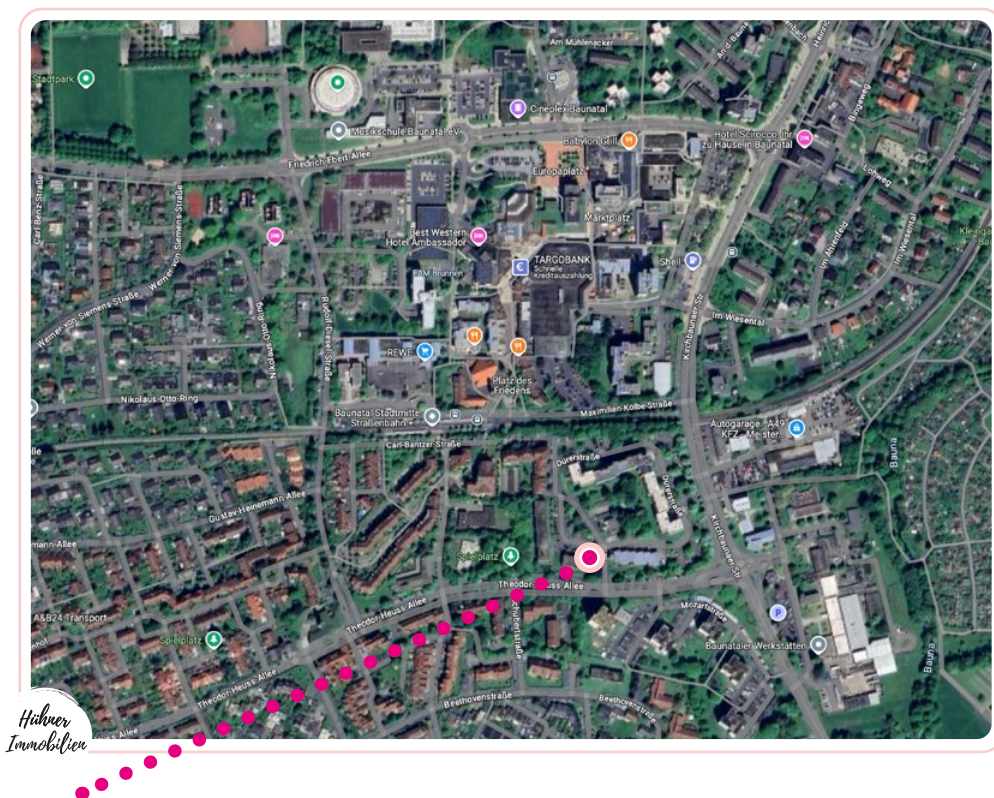
Lage der Eigentumswohnung - Dürerstr. 1, 34225 Baunatal

Die Infrastruktur und die Anbindung an den ÖPNV sind hervorragend. In nur 2 Minuten erreichen sie die Haltestelle „Baunatal Altenbauna Stadtmitte“ mit allen wichtigen Bus und Regiotram Linien.